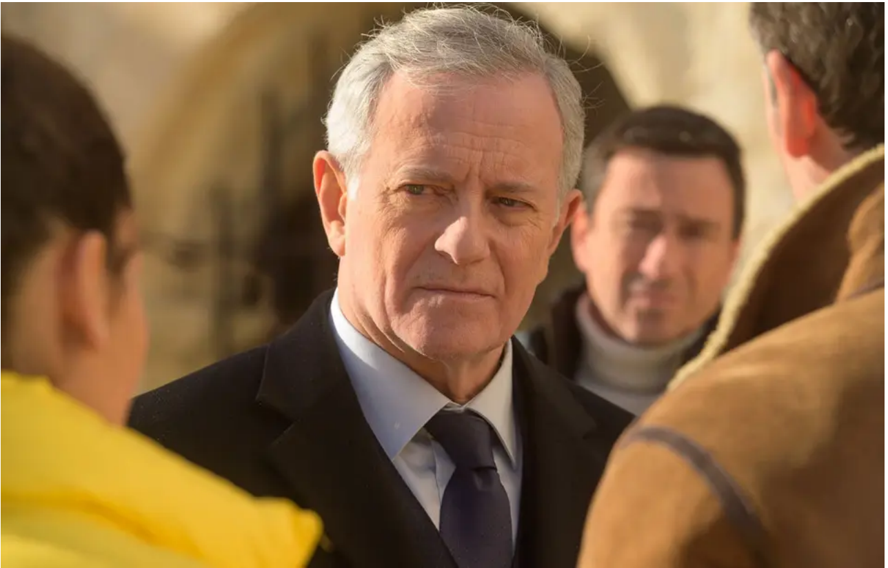
Francis Huster est le héros de « Meurtres sur les îles du Frioul » sur France 3

France 3 proposait, pour une fois, un inédit de sa collection Meurtres à... samedi soir, avec Meurtres sur les îles du Frioul , avec Francis Huster ( https://www.20minutes.fr/arts-stars/livres/2722339-20200219-pourquoi-je-t-aime ) en tête d'affiche. Le téléfilm s'est placé en tête des audiences ( https://www.20minutes.fr/arts-stars/television/audiences_tv ) avec 4,66 millions de téléspectateurs et téléspectatrices pour une part de marché de 23,9 %. Le programme devance de peu The Voice ( https://www.20minutes.fr/television/the-voice/ ) sur TF1, dont le cinquième numéro, toujours les auditions à l'aveugle, a réuni 4,52 millions de personnes (22,4 % de PDA).