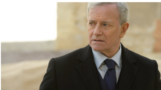
Francis Huster est Pierre Mariani, un commissaire lyonnais légendaire, qui se retrouve malgré lui à la représentation du meurtre de la victime avec qui il a effectué son service militaire. Il se positionne

Convaincant dans le rôle d'un flic légendaire, Francis Huster l'est tout autant dans celui d'un père absent qui tente « de rattraper le temps perdu ». Il se fait nommer consultant sur l'enquête du meurtre de son ancien ami, et cela déplaît beaucoup à Victor. « C'est mon enquête ! Tu n'as pas à t'en mêler », lui balance-t-il quand son père tente d'interroger certaines personnes présentes sur la scène du crime. Surtout qu'il se permet de critiquer ses méthodes. « Victor t'es flic, tu ne peux pas avoir des méthodes de voyou ! Tu dois respecter les règles ! », lui lance-t-il après qu'il a interrogé un suspect sans la présence de son avocat.